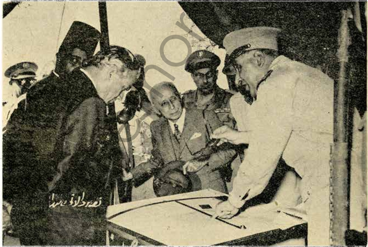
اللواء شهاب يشرح على الخريطة بعض النتائج التي اسفرت عنها تجربة المدافع التركية ، وفيخامة الرئيس شمعون يصفي اليه بافتناه ، ومن حولها وزير الدفاع وضباط لبنانيون واتراك .

وصباح الاثنين ١٣ حزيران احتفل بتسلم الهدية في ثكنة الامير بشير بمضور وزير الدفاع واللواء